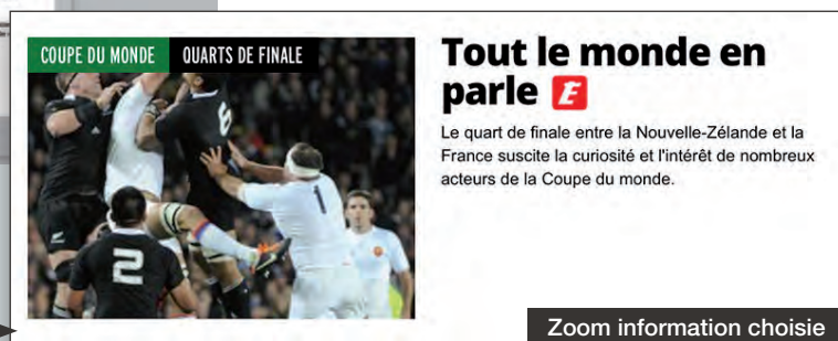
Zoom information choisie

TVTools-Play c'est aussi l'ouverture vers la réplique d'écrans depuis toute tablette, smart-phone ou ordinateur pour permettre l'affichage de ceux-ci sur l'écran principal du résident.